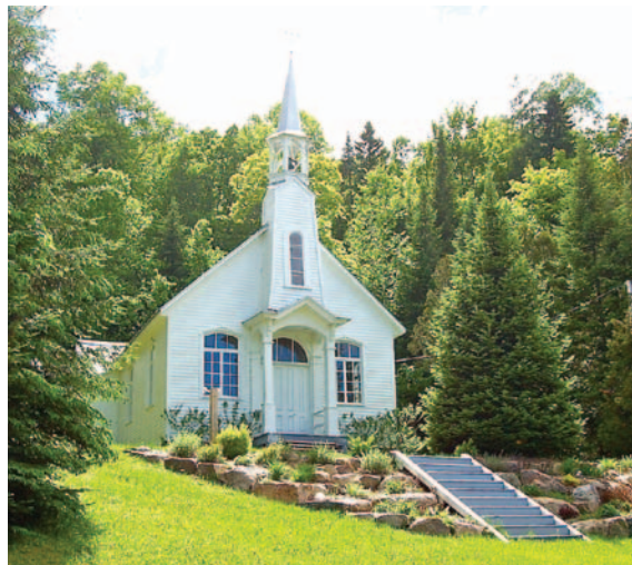
La patinoire sur le lac St-Joseph et la chapelle Gémont.

Mais même après ces départs, les Adolphins n'ont jamais perdu leur sens de la fête, comme en font foi les nombreuses activités offertes : du Carnaval d'hiver au Festival des couleurs, de la course des Bateaux-dragons à la Traversée des trois lacs, de la Fête de la famille à l'Envolée des lanternes, autant d'occasions de profiter des avantages qu'offrent la nature, les lacs, la montagne et le plein air.