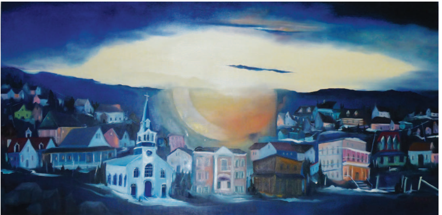
Le soleil se lève sur Saint-Adolphe, Karen Savage

L'histoire et l'évolution de Saint-Adolphe-d'Howard sont marquées par la richesse de la nature et des paysages et par la qualité de l'accueil réservé aux visiteurs et aux touristes.