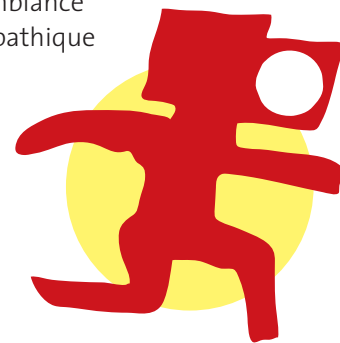
Pixel, la mascotte du Photomarathon

Nouveau venu dans le paysage culturel adolphin, L'Ange vagabond a fait son nid au cœur du village et présente chaque semaine des artistes, musiciens et chanteurs venant d'ici ou d'ailleurs. Attirés par le style intimiste de la boîte à chansons, artistes et spectateurs sont séduits par l'ambiance chaleureuse et sympathique qui se dégage de ce bistrot, devenu un véritable lieu de rassemblement culturel.