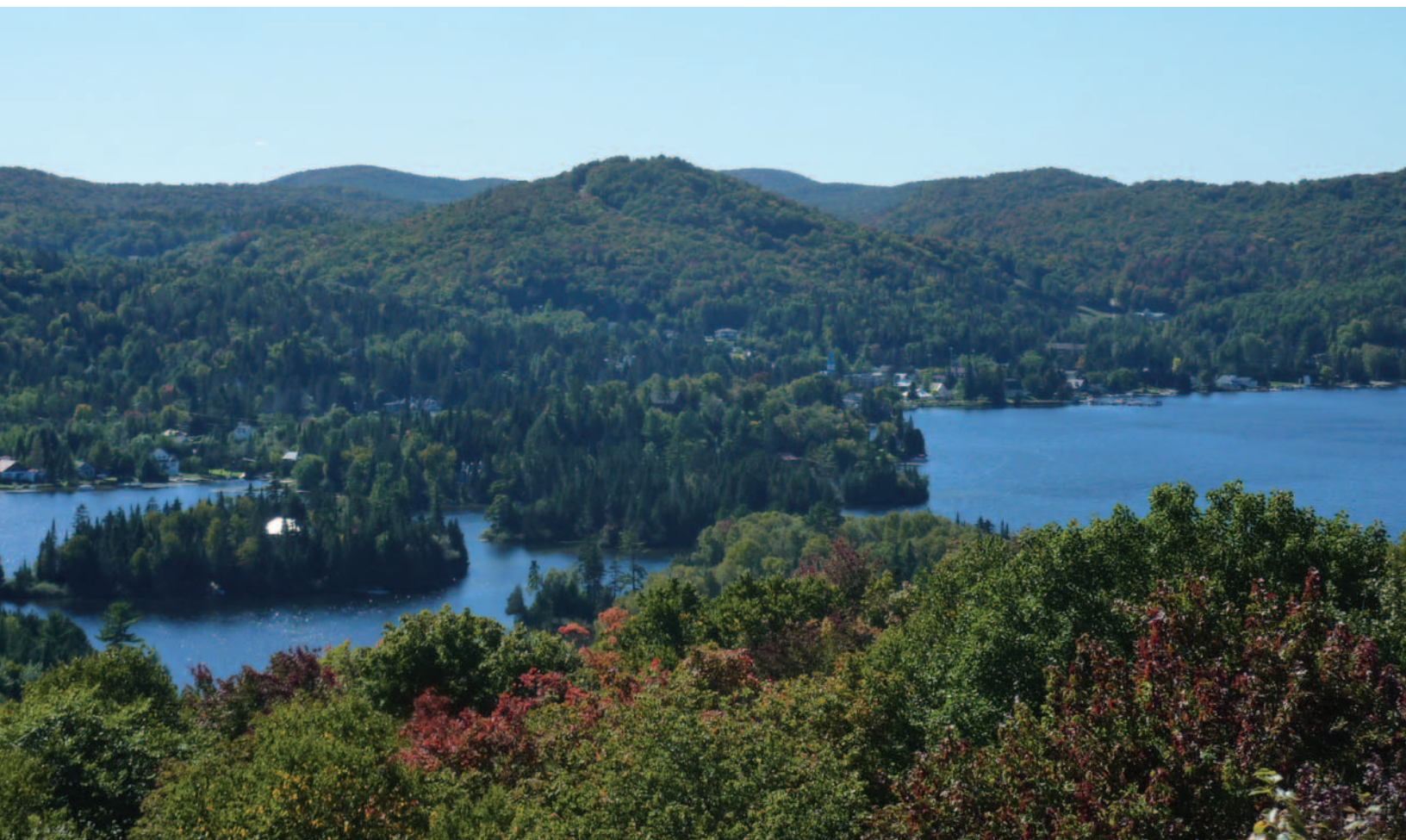
Lac St-Joseph vu du Calvaire.