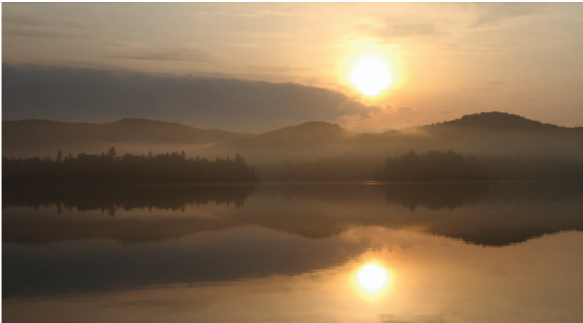
Calme matin, Éric Clément

Pour soutenir la mise en œuvre de sa politique culturelle, la municipalité s'engage à former un comité culturel chargé d'assurer la continuité et le suivi de la politique et de réaliser un plan d'action stratégique qui sera en lien avec les stratégies municipales, un plan triennal ou quinquennal, concret et efficace.