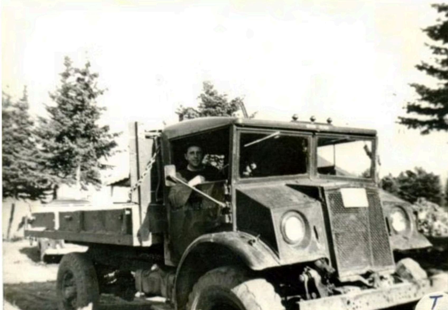
Premier camion de la municipalité, un Ford 1949.

En 1939, un décret du gouvernement provincial autorise un changement de nom pour « Municipalité de Saint-Adolphe-d'Howard ».