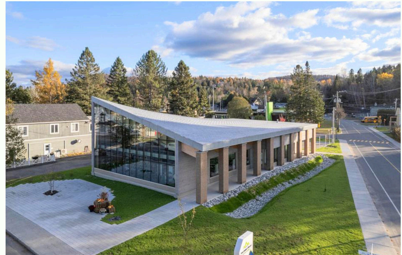
1977 Chem. du Village